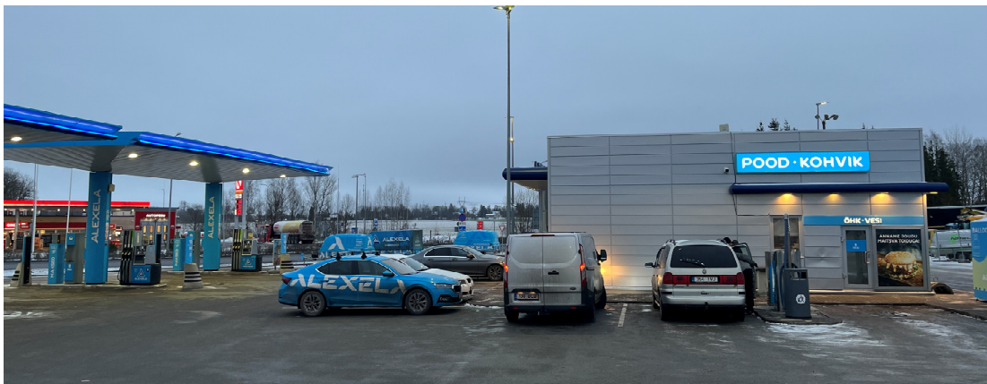
Vaade Alexela Keila tanklale